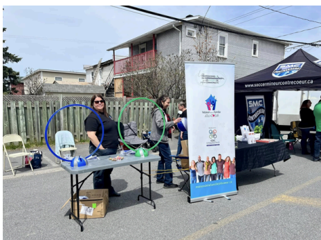
La marche de la Famille