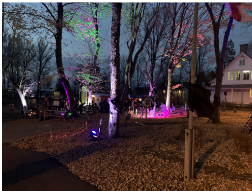
Halloween dans le parc