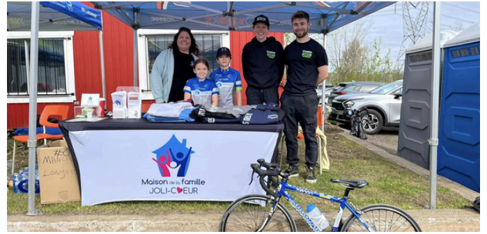
Course cycliste (Les Dynamiks)