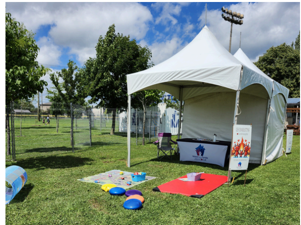
Coins des tout-petits festival Les Diablerie