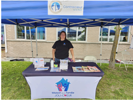
Fête des citoyens